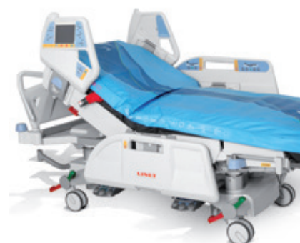
OptiCare с комплексной конструкцией.