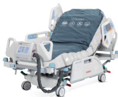
Virtuoso с нулевым давлением и трехсекционной технологией.

Противопролежневый матрас работает на принципе постоянного поочередного изменения давления воздуха в ячейках 3-частного модуля: с периодом 7,5 минут давление снижается до нуля.