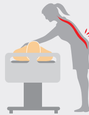
Кровать без бокового наклона. Существенный риск травм спины в поясничном отделе.

52 % медсестер жалуются на хронические боли в спине.